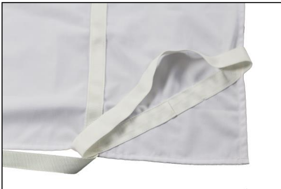
Suitable for all mattress heights