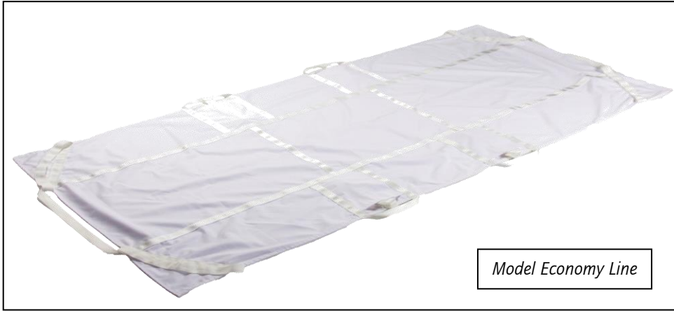
Model Economy Line