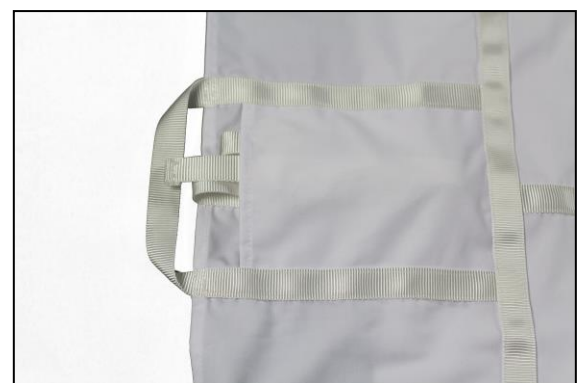
Schnallen in Taschen