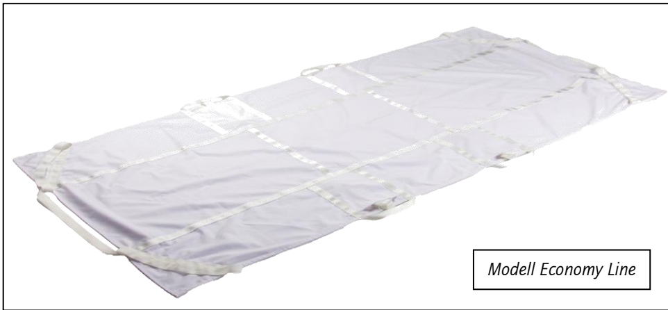
Modell Economy Line