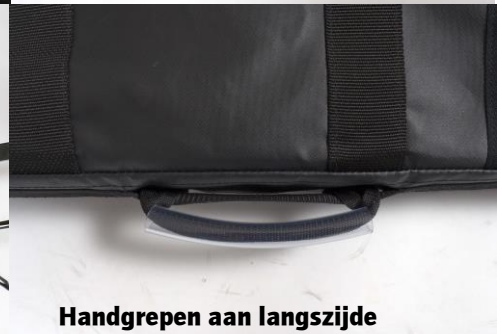
Handgrepen aan langsijde