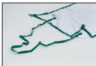
Extra lange sleepkoorden