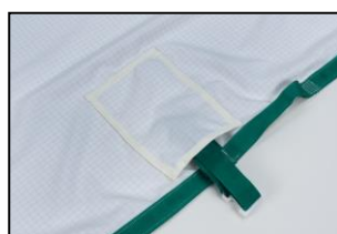
Gespen in hoesje